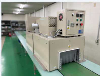
シュリンクトンネル