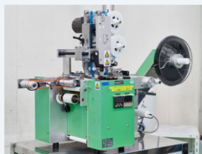
セルフラベル自動捺印機 (デジタル式)