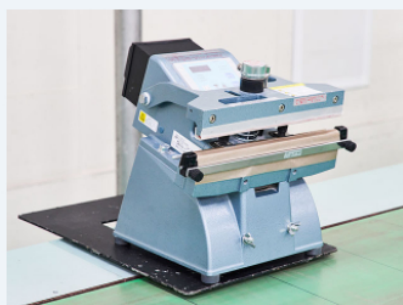
樹脂製袋シーラー