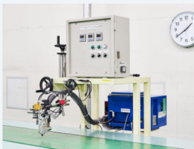
ホットメルトアプリケーター