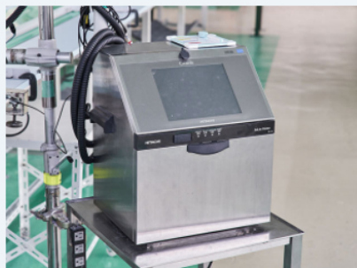
製造記号捺印機 (IJプリンター)