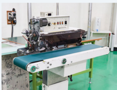
樹脂製袋シーラー